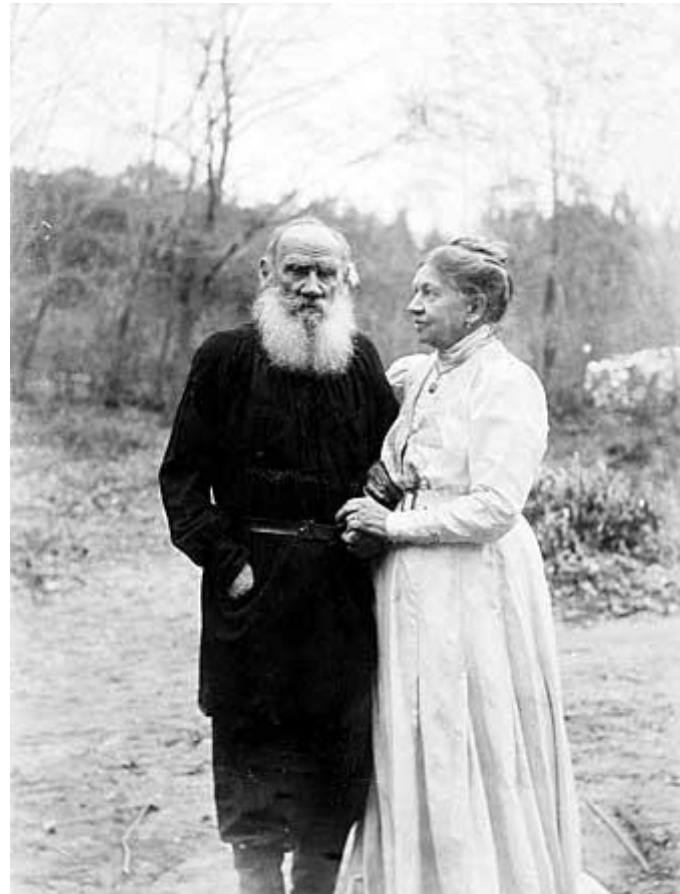
Lev Tolsztoj és Szofja Andrejevna