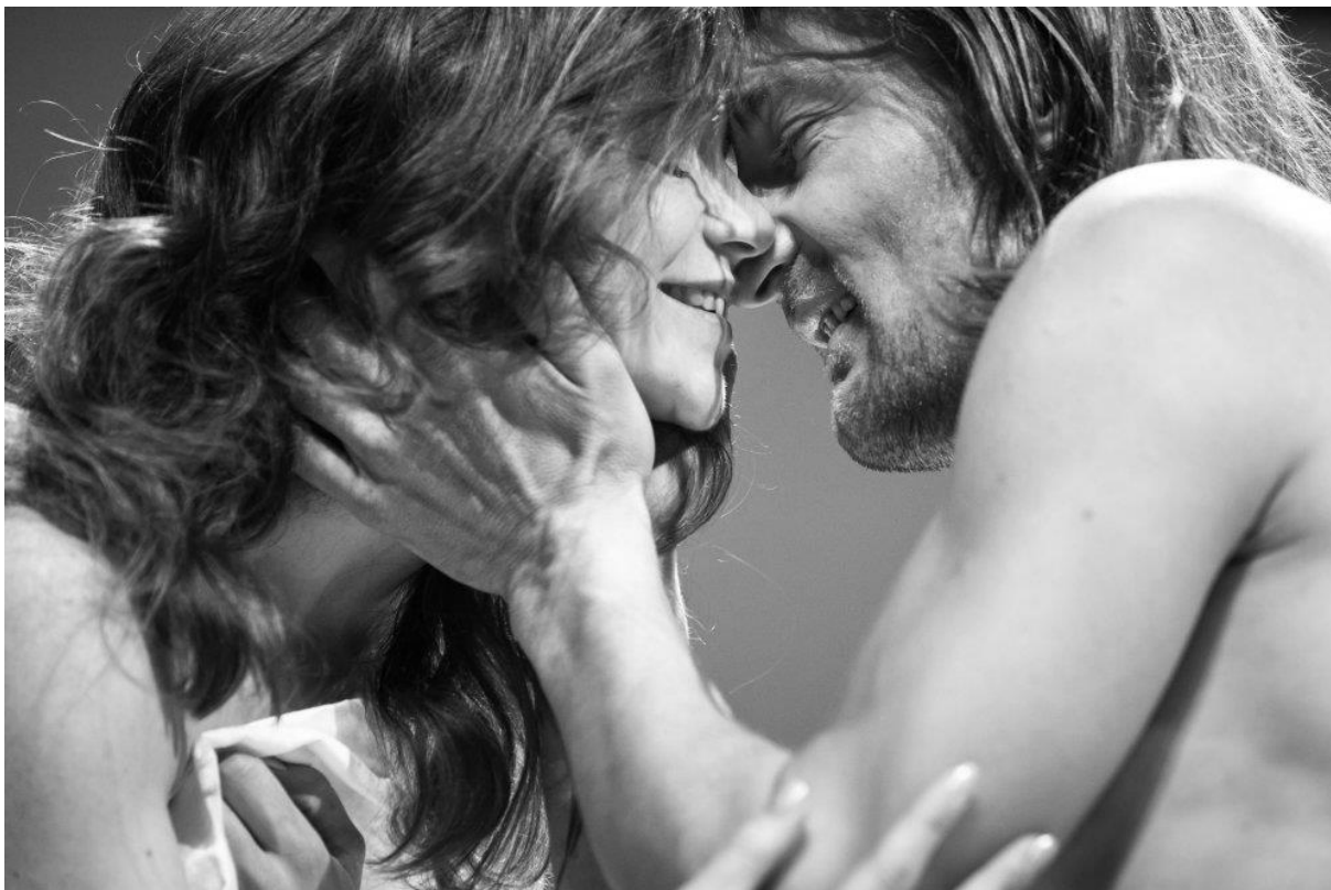
Részlet a Pesti Színház előadásából