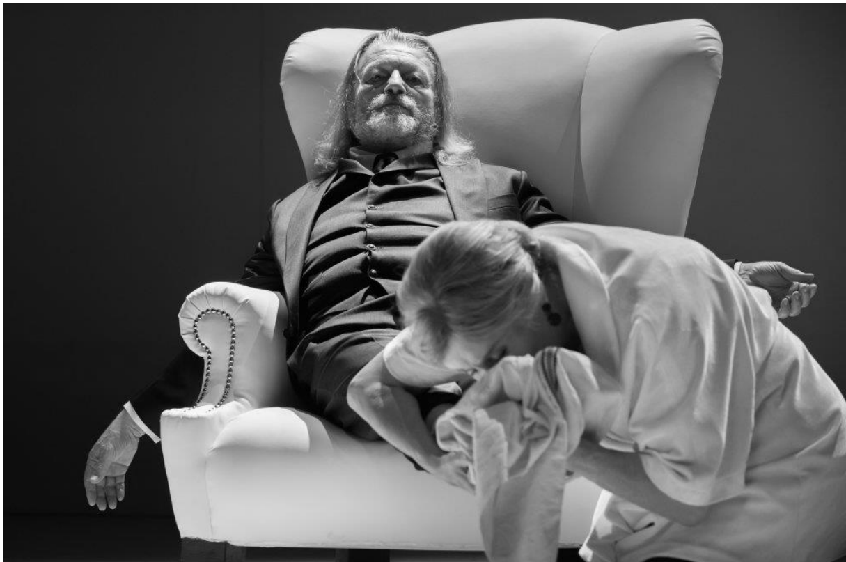
Részlet a Pesti Színház előadásából