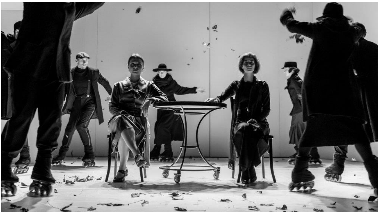
Pillanatképek az előadásból