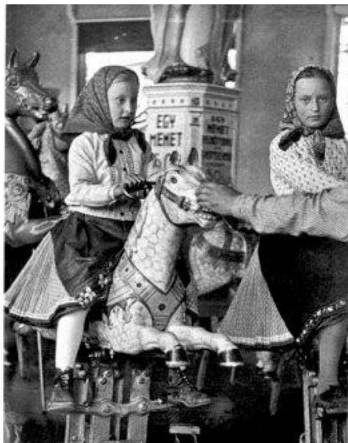
Kislányok a körhintán 1906-ban

A Városligetben (korábbi nevén Városerdőben) már az 1800-as évek elején tartottak rendezvényeket, igaz ekkoriban még csak különleges alkalmakkor. A sétára és találkozókra használt erdős területen többnyire az arisztokraták fordultak meg, míg a szegényebb rétegek vagy a város szélén vagy a városban alkalmilag tartott vásárokból töltötték csekély szabadidejüket. A vurstliban megtalálható szórakoztató tevékenységek elterjedéséhez a legfontosabb az átlagemberek szabadidejének növekedése volt. Ez a feltétel a század első felében még nem teljesült. A XIX. század végén a legtöbben napi 10 vagy 12 órás munkaidőben dolgoztak, a szabad vasárnapot 1891-ben foglalták törvénybe Magyarországon, a két napos hétvége pedig csak az 1960-as évekre vált általánossá Európában. A szabad vasárnapok, valamint Budapest lakosságának növekedése azonban kedvezett a vurstlinak és a tömegek szórakozását szolgáló intézményeknek. Az 1860-as évektől rendszeressé váltak a tömegrendezvények és a vurstli állandó helyre települt, ahol állandó bódékkal, épületekkel és játékokkal várta a látogatókat. A város közlekedésének jobb kiépülése nagyban hozzájárult a terület fejlődéséhez és népszerűségének növekedéséhez. Megépült az Andrássy út (Sugárút néven, 1883), elkészült a földalatti vasút (1896), valamint egyéb busz- és villamos vonalak futottak a liget környékén.