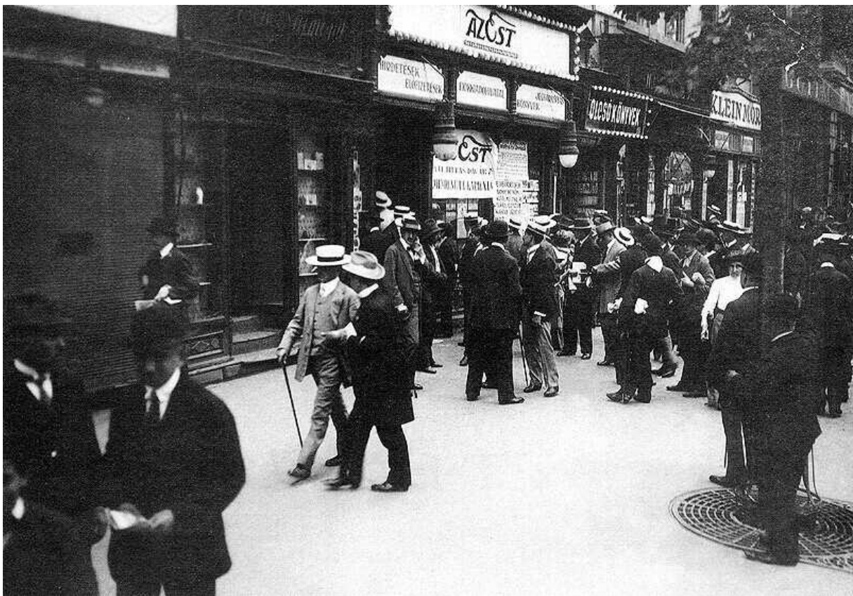
Hírlapért sorban állók az Est épülete előtt 1912-ben

Szépirodalmi munkái és színházi szövegei mellett újságíróként is jelentős szerepet vállalt a főváros életében. Gyermekkorától kezdve gyártotta a lapokat. Kezdetben kézzel írt újságokat készített egy-két példányban, majd külföldi tudósítói jelentések első cikkei. Harminc éves koráig munkatársa volt A Budapesti Naplónak , a Fővárosi Lapoknak , a Pesti Naplónak , az Estnek , a Hétnek és az Új Időknek . Ezek mellett más újságokban is feltűntek írásai: A Pál utcai fiúk például folytatásokban jelent meg a Tanulók Lapjában . Műveit Budapest különböző részein írta, kedvenc „munkahelyei” közé tartozott a körüti Művész kávéház karzata, a New York kávéház és a margitszigeti Kisszálló.