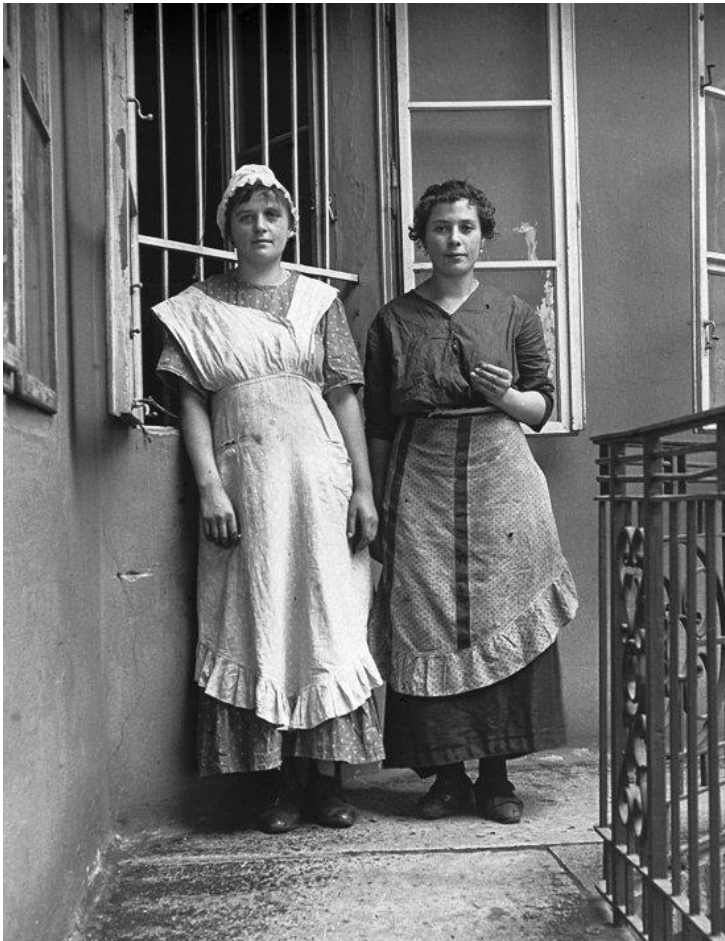
Cselédlányok a gangon

Az alkalmazottak többsége a családnál lakott, és a nap 24 órájában készen kellett állnia a szolgálatra. Nagyobb lakásokban lehetett cselédszoba, de az esetek többségében a konyhában elhelyezett kinyitható ágyon aludtak az alkalmazottak. „Akármilyen tágas volt is különben a lakás, s a régi vidéki családi házakban nemritkán tíz-tizenkét szoba is állott a családtagok rendelkezésére – a szakácsné és a mindenes cselédlány ott aludtak a konyhában, ahol naphosszat főztek és mosogattak. Reggel ott mosakodtak a konyha vízcsapjánál, amelynek leöntőjébe a moslékot és a szennyvizet is öntötték. Ocsmány és érthetetlen helyzet volt ez, de senki nem törte a fejét rajta, a társadalom így rendezkedett be.” (Márai Sándor: Egy polgár vallomásai).