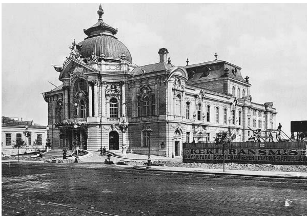
A Vígszínház 1896-ban

A Vígszínház 1890-es első tervében a műsorterv kizárólag bohózatokra és vígjátékokra épült. Erre azért volt szükség, hogy a három másik állandó budapesti színház műsortervével ne ütközzön a frissen alapított magyar nyelvű színház repertoárja. Hosszas viták után végül a terv elfogadásra került, és 1896-ban megnyílt a Vígszínház. Előkelő, gazdagon díszített, a polgárság igényeit kielégítő épületet tervezett a korszak híres bécsi színházépítész párosa, Ferdinand Fellner és Hermann Helmer.