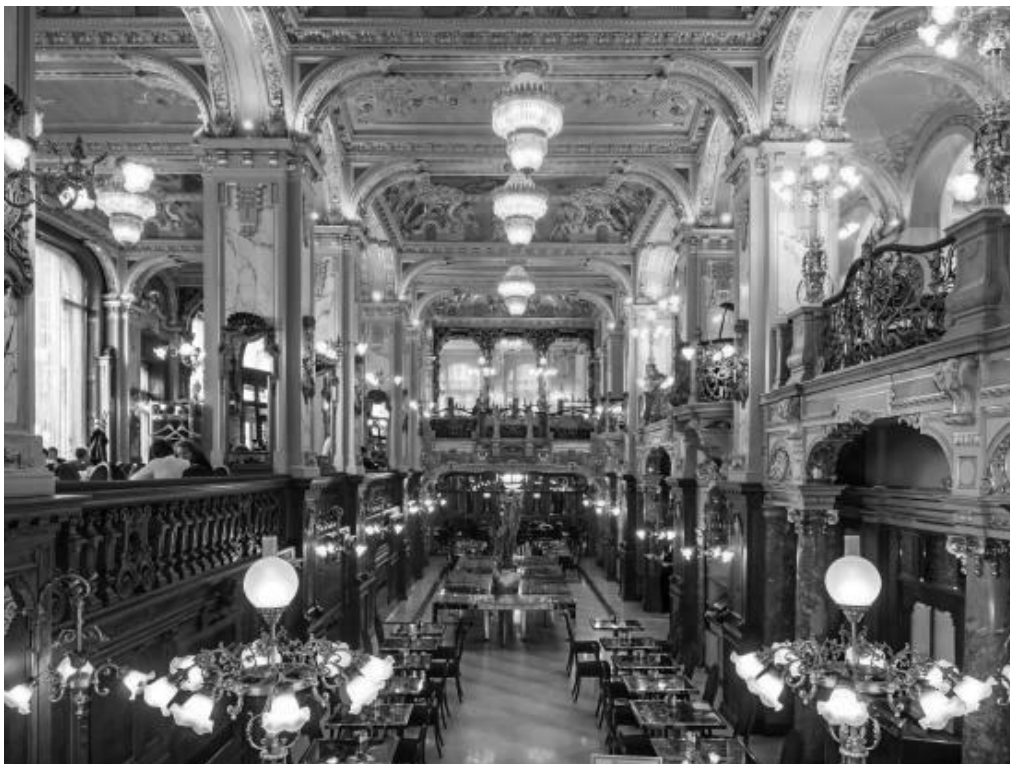
A New York kávéház Molnár Ferenc korában és ma