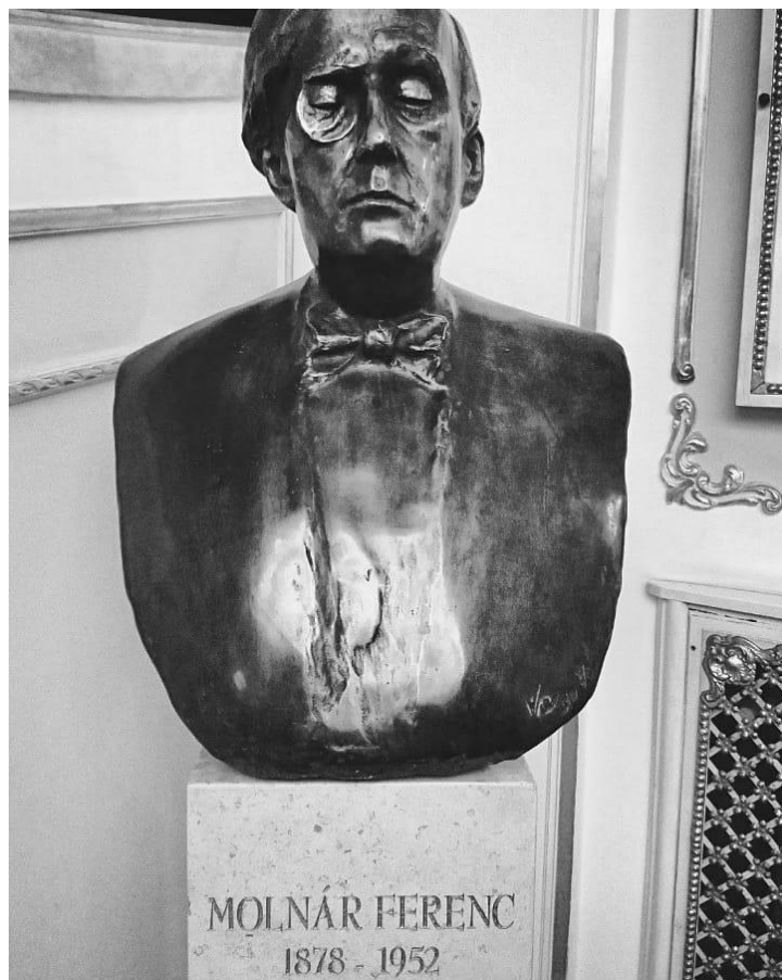
Molnár Ferenc szobra a Víg színházban

A Liliom szerzőjének sikerei mellett fontos megemlíteni, hogy a XX. század elején a Víg színház bebizonyította: lehet sikeres színházat építeni kortárs magyar szerzők műveire. Olyan korszak volt ez, amelyben a közönség már túllépett bizonyos erkölcsi korlátokon és rutint szerzett a színházi előadások terén. Nem háborodott fel az újításokon és nem kért számon olyan szabályokat, amelyeket a színház és az irodalom akkorra már régen meghaladott. Az 1910-es évekre a színház repertoárja gyökeres változásokon ment át és a francia bohózatok helyébe a magyar drámairodalom legfrissebb művei kerültek.