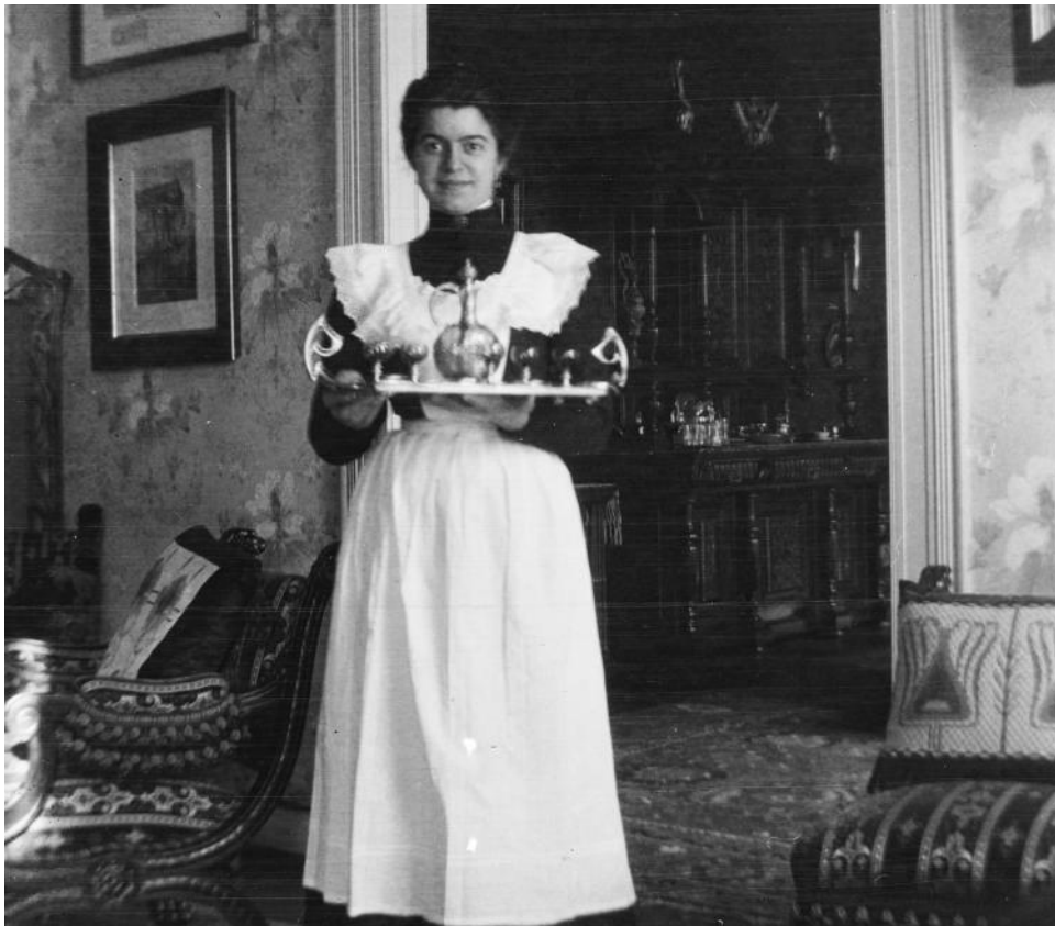
Háztartási alkalmazott Budapesten A XX. század elején a Nádor utcában