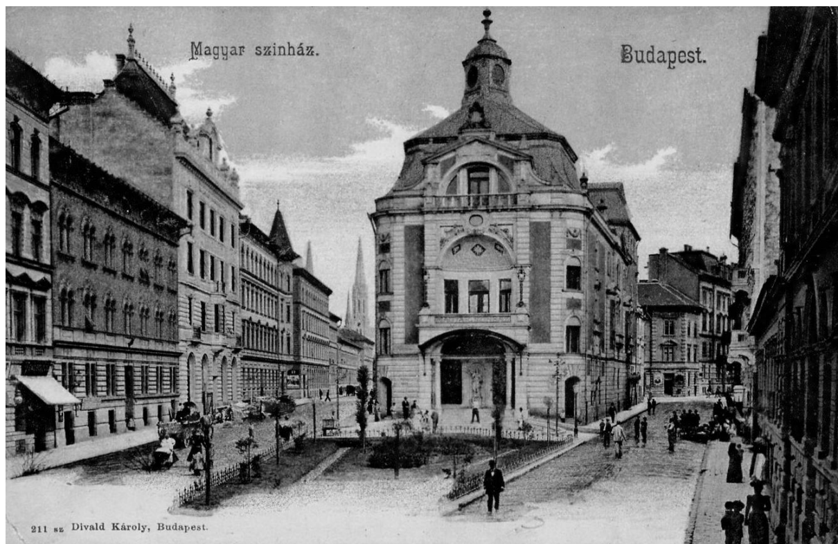
A Magyar Színház épülete egy korabeli képeslapon

Molnár Ferenc színházak számára írt szövegeit világszerte bemutatták. Első nemzetközi sikerét Az ördög című vígjátékával aratta, amelyet a budapesti előadás után egy évvel már 32 nyelven játszottak a világ színpadain. A nemzetközi sikerekhez azonban szükség volt a magyar színházi élet adta háttérre, amely lehetőséget adott Molnárnak a megmutatkozásra és az újabb bemutatókra.