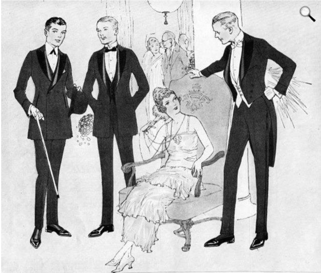
Polgári divat a XIX. század második feléből