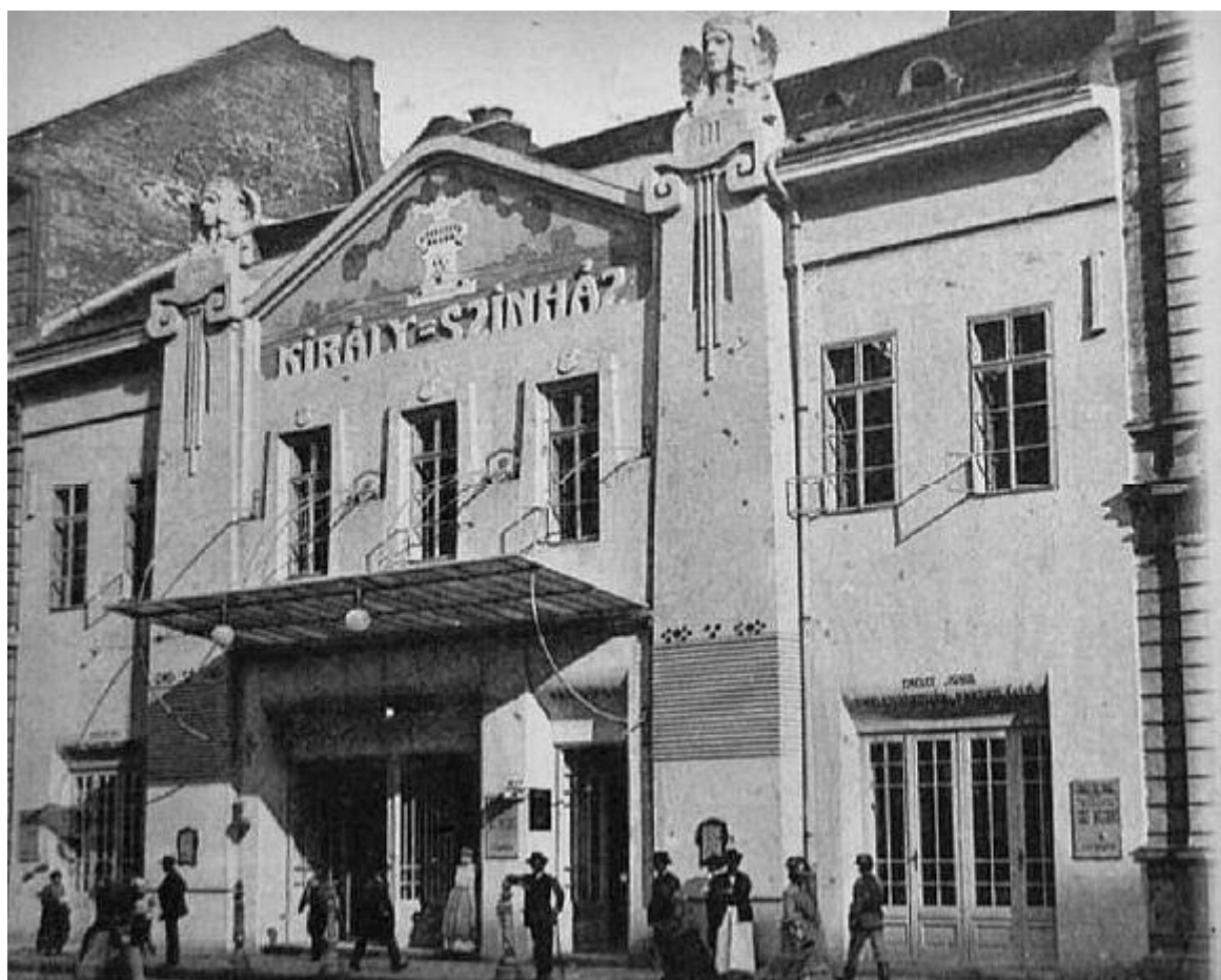
A Király utcában épült Király Színház

A gyorsan változó repertoár és a dominánsan megjelenő külföldi színdarabok miatt sok műfordítóra volt szükség. Molnár Ferenc is fordítóként kezdett dolgozni a Vígszínházban és ez a munka kiváló iskola volt számára. Megismerte a francia sikerdarabok dramaturgiáját, amelyet később ő maga is részben alkalmazott, illetve megújított. A fordítások mellett a század vége felé egyre hangsúlyosabban jelentek meg hazai szerzők művei is a színpadokon. A színház fejlődése tehát elősegítette az irodalom fejlődését, és bemutatkozási lehetőséget jelentett a korszak számos írójának.